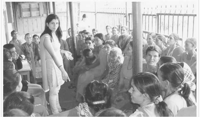
Die Veranstaltungen zu Themen der Gesundheit und Hygiene finden immer sehr großen Anklang.