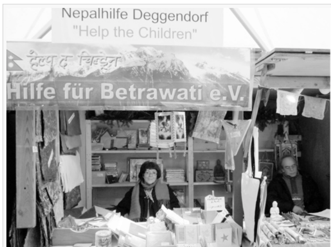
Am Bunter Markt in Deggendorf informierten wir über die Arbeit von Hilfe für Betrawati e.V. und verkauften Produkte aus Nepalpapier