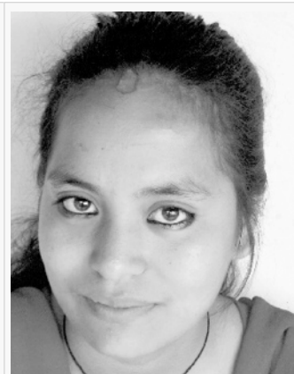
Bariyat Rachana , Paten: Travi-net GmbH