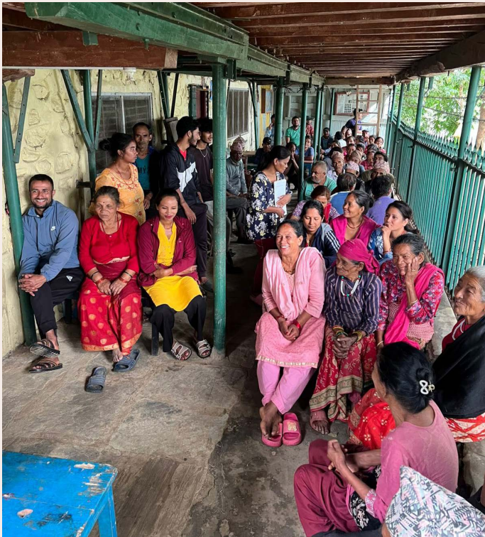
Erwachsene im Workshop - Wissen, das im Alltag ankommt.