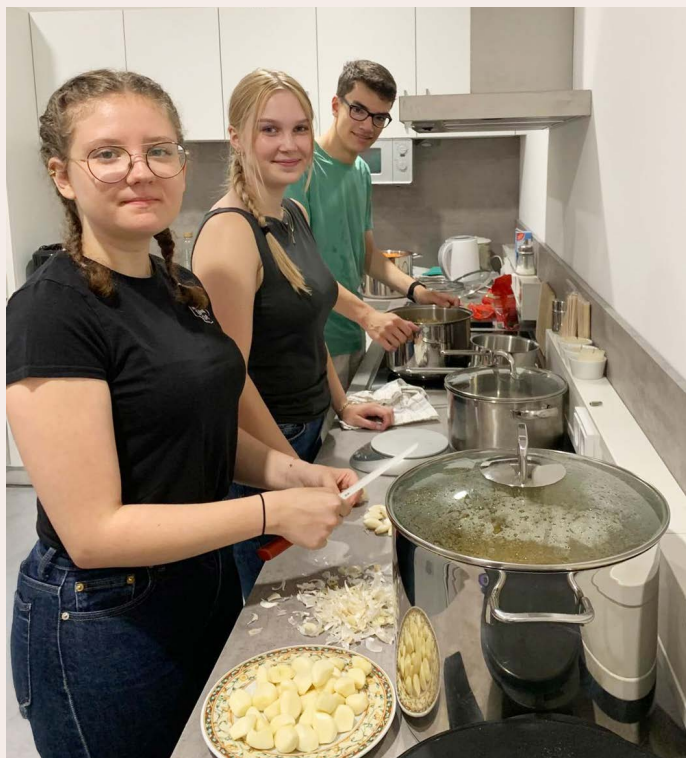
Nepaltag St. Gotthard Gymnasium Niederalteich

Diese Aktionen sind mehr als finanzielle Unterstützung: Sie schaffen Bewusstsein, verbinden Menschen und machen unsere Arbeit sichtbar. Jeder Beitrag - ob groß oder klein - hilft direkt vor Ort.