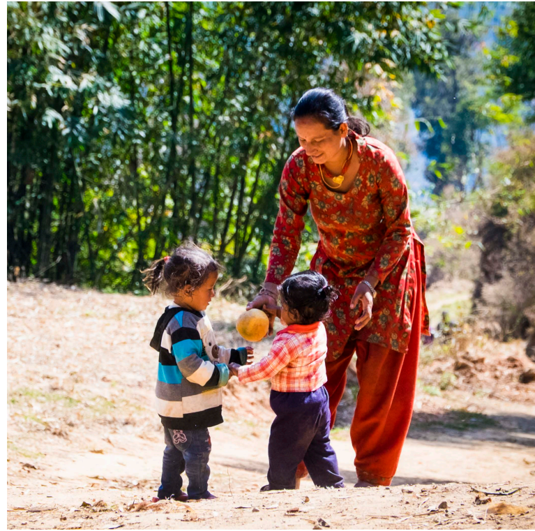
Alltagsszene Dorf - Bildung beginnt schon vor der Schule.

Bildung bleibt ein Kern unserer Arbeit – zunehmend auch in Form alltagsnaher Trainings für Kinder und Erwachsene. Themen wie Hygiene, Gesundheit und nachhaltige Landwirtschaft stärken Familien langfristig.