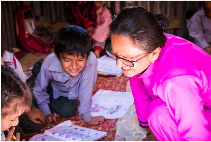
Training mit Kindern - Lernen heißt Zukunft gestalten.