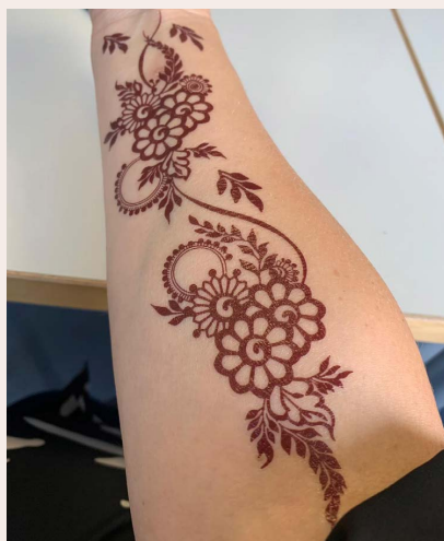
Engagement mit Herz