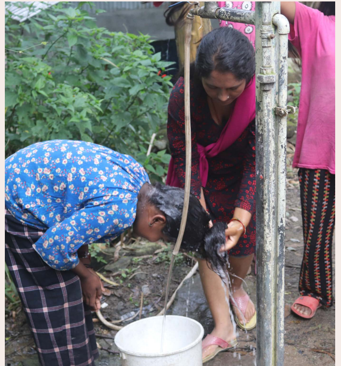
Erwachsene und Kinder im Workshop

In vielen Regionen zeigen sich die Erfolge deutlich: Familien handeln selbstständig, geben Wissen weiter und gestalten ihren Alltag eigenverantwortlich. So wird nachhaltige Unterstützung sichtbar.